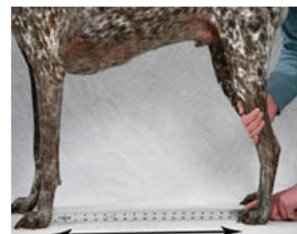
C (前肢かかと～後肢つま先)